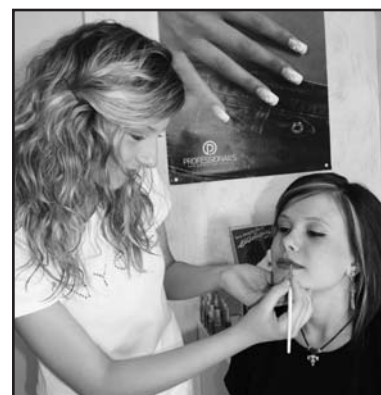
Servizio completo ed accurato da "Ciocca d'Oro" a S. Bernardino.

È possibile usufruire di tutti i tradizionali servizi estetici, con una particolare attenzione al trattamento del viso con pro-