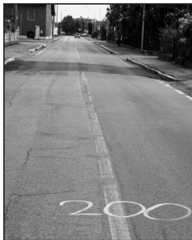
Il ripristino della strada in zona MCL.

ministrazione comunale per risolvere il problema.