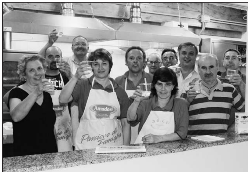
Il brindisi di auguri da parte del Gruppo Sportivo di Borgosotto.

Il Gruppo sportivo, forte della tradizione e dei molti volontari riesce a proporre il secondo torneo notturno, come importanza sul territorio bresciano, grazie anche alla ormai nota cucina che attira non solo