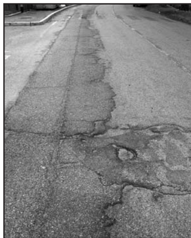
Un tratto della strada davanti al Ritrovo Giovanile di S. Giustina.

Un tratto di strada dove le macchine sfrecciano a velocità sostenuta ed una raccolta di firme aveva sollecitato l'Am-