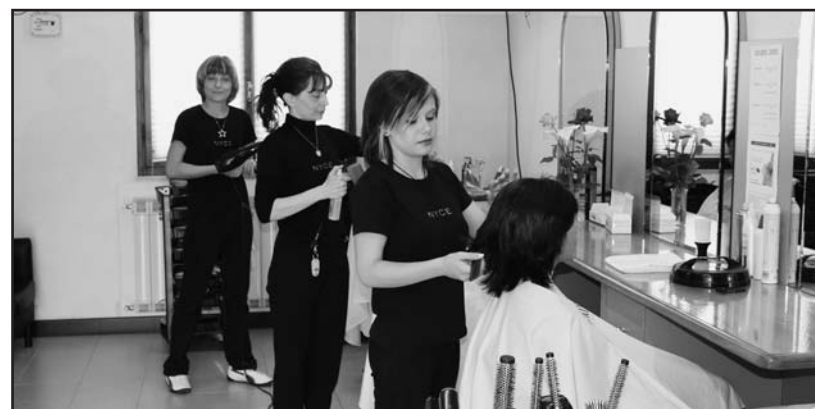
Al lavoro con professionalità.

Per informazioni telefonare allo 030 964985.