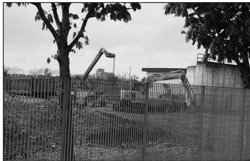
Lavori in corso al depuratore.